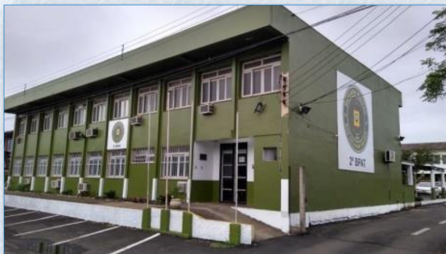
Sede do 2º BPAT e da 1ª Companhia Rua da Brigada Militar, nº 330, Capão da Canoa

A sede do 2º BPAT fica em Capão da Canoa e sua responsabilidade de atuação vai além desse município, abrangendo Xangri-lá, Terra de Areia, Itati e Três Forquilhas, na área da 1ª Companhia; Torres, Arroio do Sal, Três Cachoeiras, Mampituba, Morrinhos do Sul e Dom Pedro de Alcântara, na área da 2ª Companhia; e Tramandaí e Imbé, na área da 3ª Companhia.