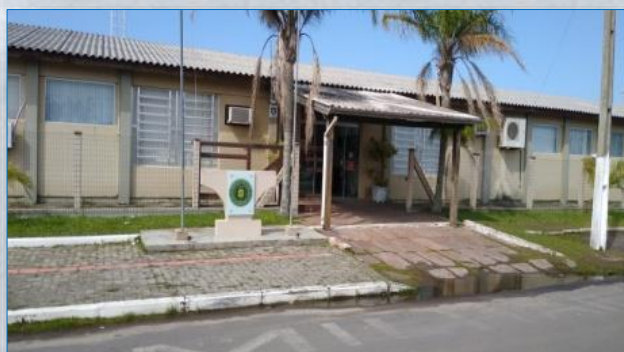
Sede da 3ª Companhia do 2º BPAT Avenida Emancipação, nº 1945 Tramandaí