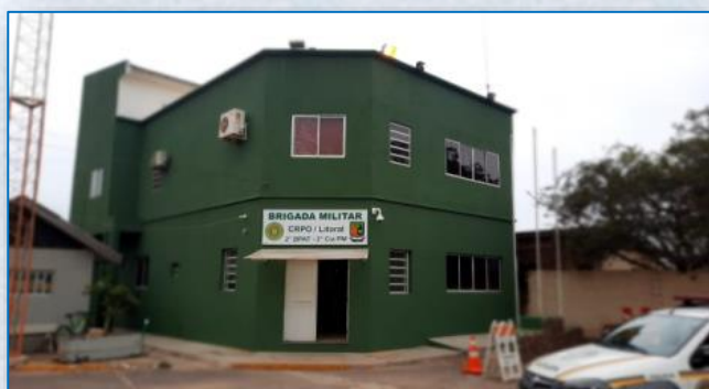
Sede da 2ª Companhia do 2º BPAT Avenida Castelo Branco, nº 1579 Torres